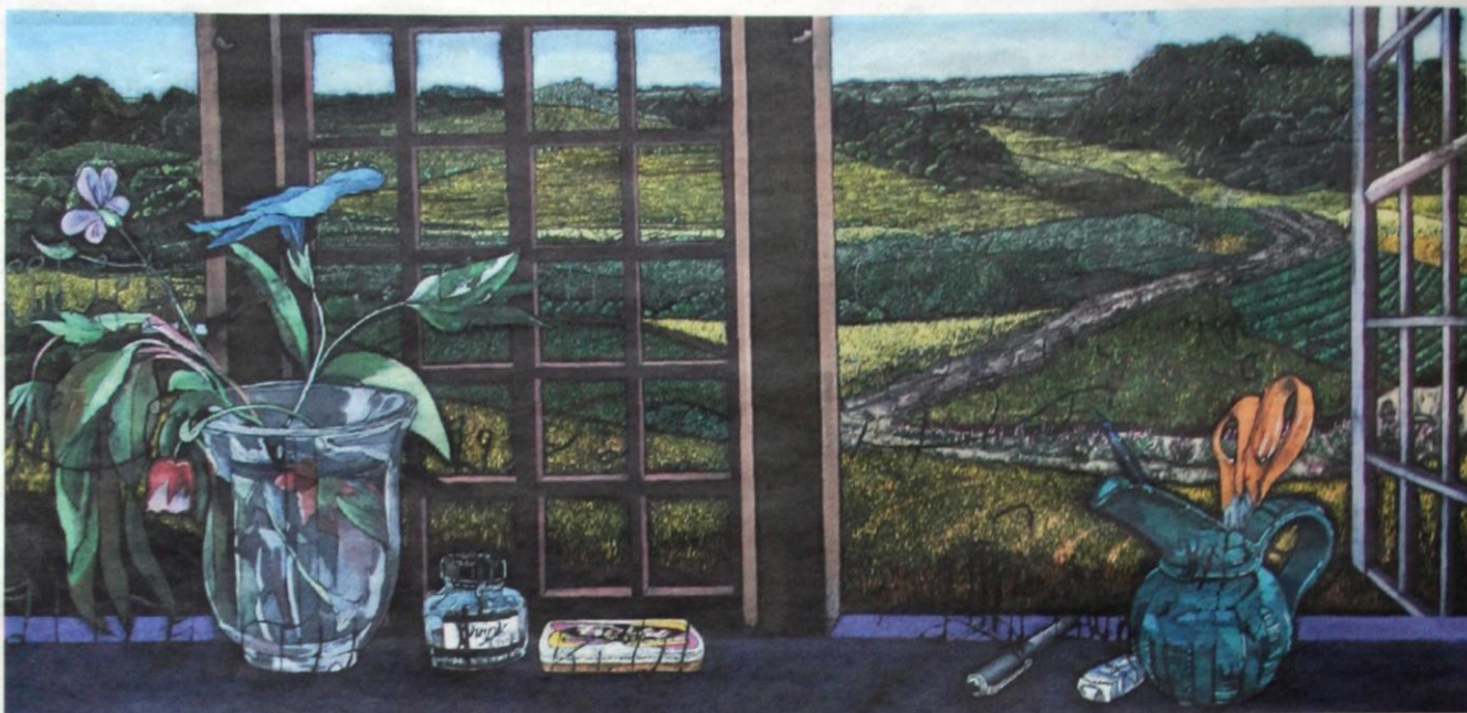
Jesper Christiansen, Paradismaleri # X.