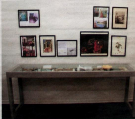
Maleriudstillingen ledsages af et lille formidlingstableau i galleriets baglokale.

plan er der også en leg med det cyklistiske tema, man genfinder i Dantes værk.