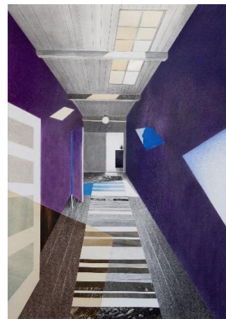
'Being Home with Agnete Swane II' 116x83 cm