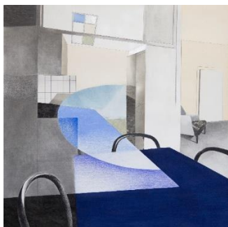
'Alrum', 2024 90x90 cm

Med en fornyet interesse for det taktile afsøges håndarbejdet og med det følger ligeledes en fascination af vores arv og arvestykker. Sammenhænge etableres, det er en balanceakt, for det er absolut ikke en boligreportage over den gode smag Julie Boserup vil - hun vil det nære, det oversete, transitionen, mellemrummet.