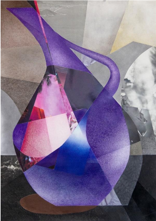
'Surface Catcher I', 2024 140x100 cm

Den svenske keramiker, Wilhelm Kåge, skabte omkring 1940 en serie objekter kaldet Surrea for Gustavsberg, de udfordrede de gængse keramiktyper, han forskød virkeligheden og satte den sammen på ny. Hermed opstod vaser og fader i ofte hvid glasur med lys og skyggevariation og nye rumligheder skabtes i de hjem hvor de blev anvendt.